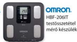
OMRON. HBF-206IT testösszetétel mérő készülék