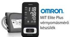
OMRON. MIT Elite Plus vérnyomásmérő készülék