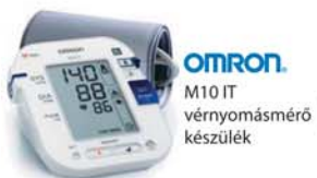
OMRON. M10 IT vérnyomásmérő készülék